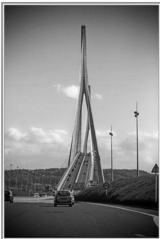
Híd Le Havre-ban

13. tétel: A héber felfogás szerint az ember nem osztható fel testre és lélekre. Jézus üzenete és működése ezért egyszerre irányult a testi és a lelki gyógyításra. Jézus csodái nem választhatók el igehirdetésétől, céljuk, hogy hihetővé tegyék szavait.