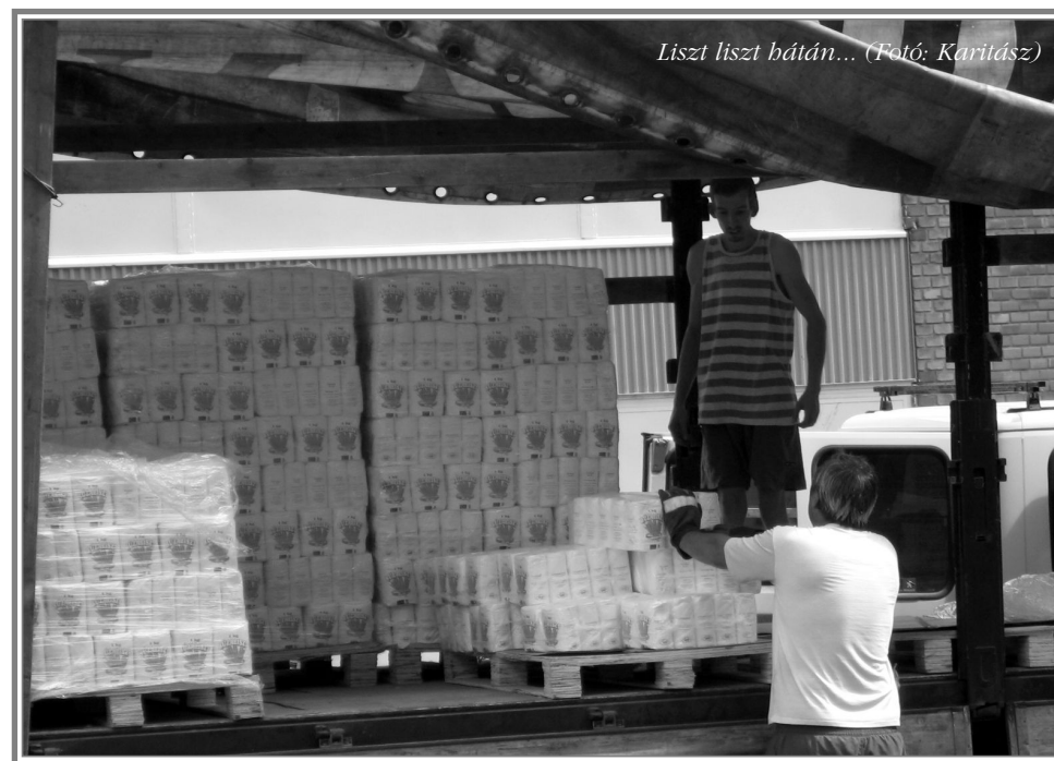
Liszt liszt hátán...