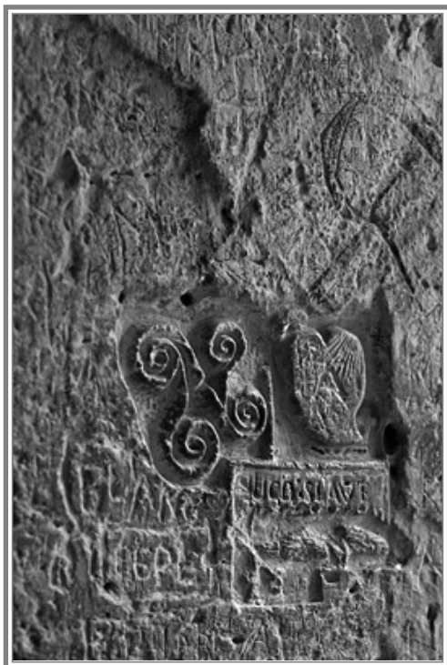
Cellafal If várában

10. tétel: Az istenszeretet hitelességének kritériuma a felebaráti szeretet. Épp az úgynevezett jámborokat nem csak az isten-tagadók vádja figyelmezteti: „Mivel senkit sem szeretnek, azt hiszik, Istent szeretik” (Charles Péguy). Az „irgalmas szamaritánus” példázta, hogy ez a szeretet nem zárhatja ki a más felekezethez tartozó embereket; sőt Jézus egyenesen arra szólít fel, hogy az ellenségre is érvényesnek kell lennie.